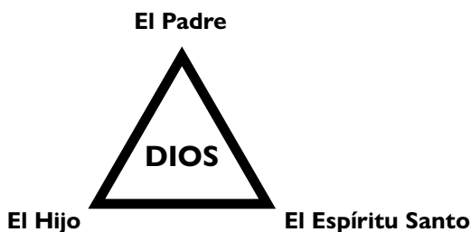
Ilustración: Una de las ideas más difíciles sobre Dios es la Trinidad .